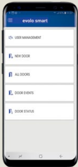
Smartphone för programmering